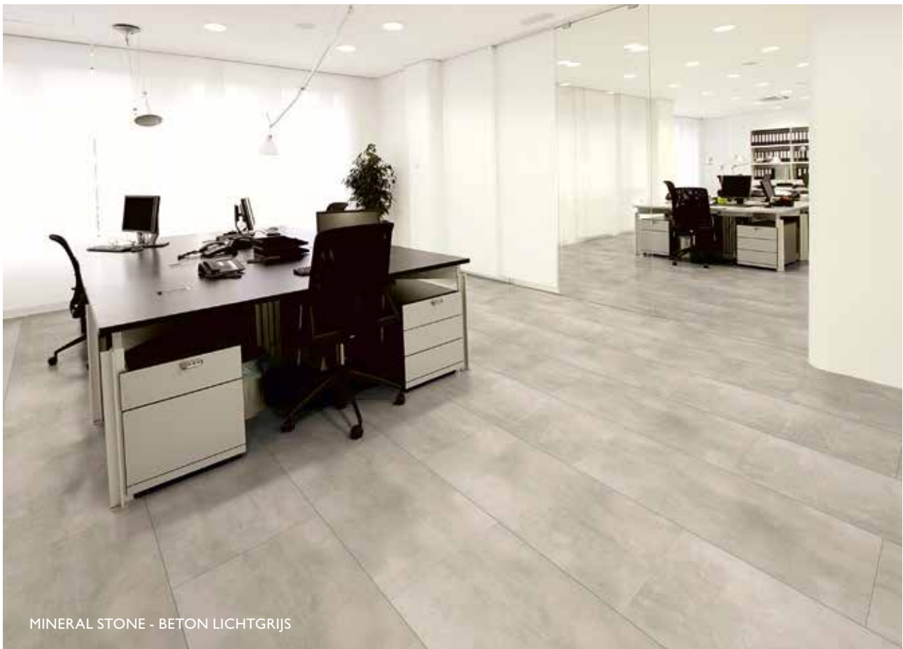
MINERAL STONE - BETON LICHTGRIJS