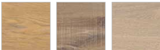
Eik select honing