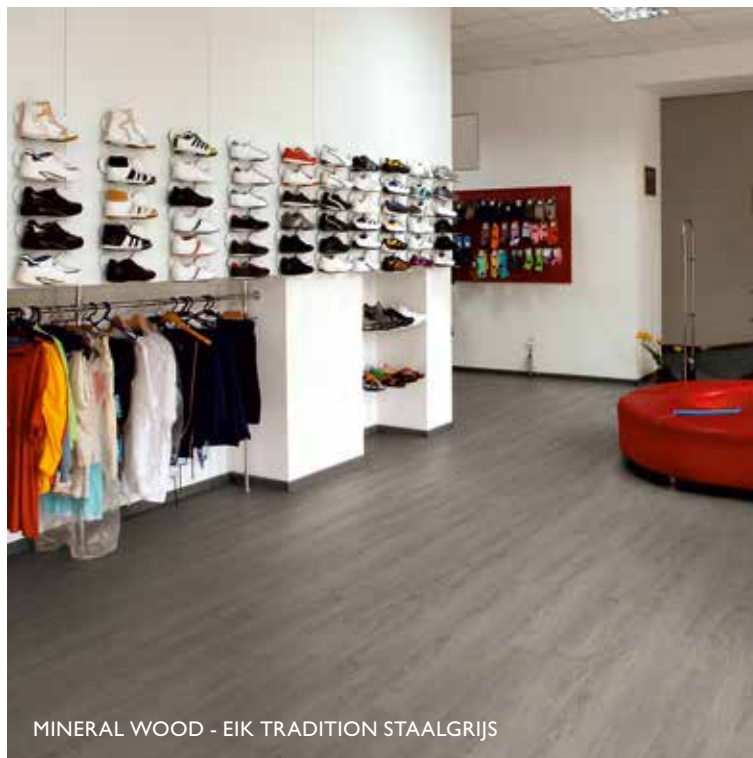
MINERAL WOOD - EIK TRADITION STAALGRIJS

Restaurants, luchthavens, beurshallen, winkelcentra: met zijn uitstekende eigenschappen zoals gebruiksklasse 23 voor huishoudelijk en 33 voor commercieel gebruik en brandklasse Bfl-s1 (moeilijk ontvlambaar) is Mineral® perfect geschikt voor alle openbare, publieke binnenruimtes.