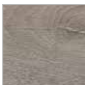
Eik tradition staalgrijs